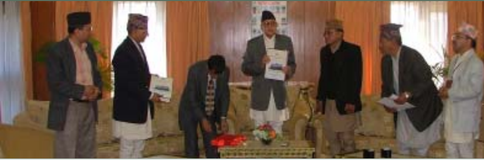
आयोगको बार्षिक प्रतिवेदन ग्रहण गर्दै प्रधानमन्त्री श्री गिरिजाप्रसाद कोइराला