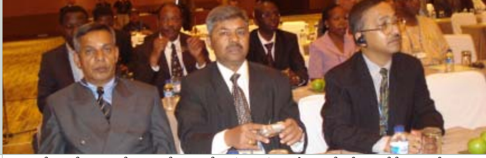
भ्रष्टाचार नियन्त्रण विषयक अन्तरक्रियामा अन्तरिम व्यवस्थापिका संसदका सांसद, आयोगका पदाधिकारी र अन्य विशिष्ट सहभागीहरू