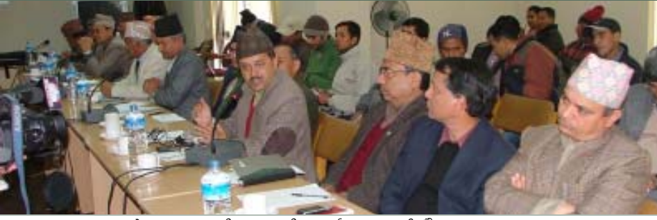
नेपाल सरकारका सचिवहरू अन्तरक्रिया कार्यक्रममा सहभागी हुँदै